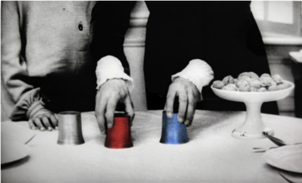
The Game, 2012, Series of 9 prints on baryta, hand-painted intervention, 40 x 50 cm View from Suspect Language, Goodman Gallery, 2012, Cape Town. Ed. of 5 + 2 A.P.

L'œuvre photographique The Beautiful language présente six séries de photographies en noir et blanc portant chacune un titre : "Le Jeu", "Le Bandeau", "La Crise", "La Punition", "Le Piège" et enfin "La Naissance". Les images en noir et blanc sont extraites du film L'Enfant sauvage de Truffaut (1970) qui s'inspire de l'histoire vraie d'un enfant non civilisé et ne possédant pas le langage qui se voit un jour capturé par des paysans au 18e siècle, puis recueilli par un médecin qui l'étudie et fait son éducation. Les images comportent des éléments colorisés et donnent également à voir des motifs calligraphiques en surimpression, occultant partiellement la scène et les personnages présents.