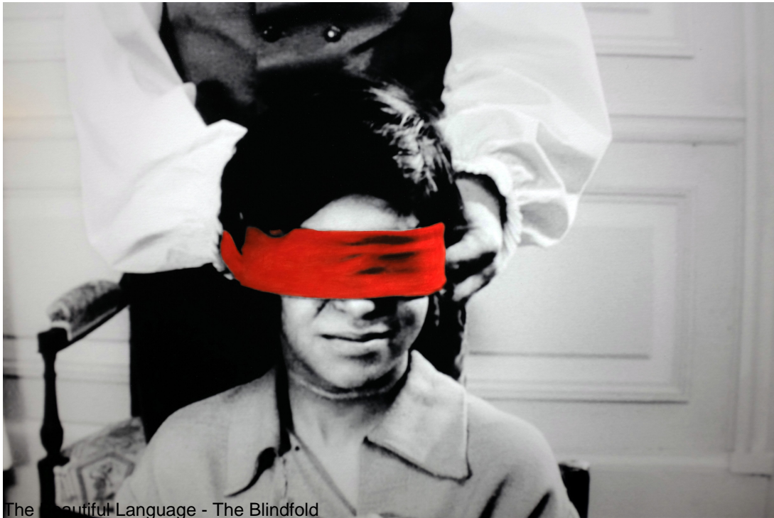
The Beautiful Language - The Blindfold

Education offers insight on the world and provides a multitude of perceptions and reflections, while at the same time imposing a unique and dominant vision of the world, and as such it constitutes a form of blindness. It aims to be a preparation for one's existence and an enrichment of the experience of life, yet at the same time it provokes the destruction of the subject's innocence, youth and carefreeness.