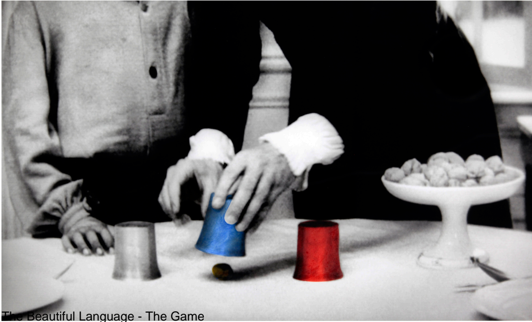
The Beautiful Language - The Game

The Beautiful Language questions education and the processes of language acquisition. The work observes the attitudes of the characters and their relations over the course of the pedagogical interaction that is depicted. In this way, it enables the exploration of notions such as “savagery” or “civilization” and the study of their relations, while evoking the question of alterity and of the perception of cultural differences in general.