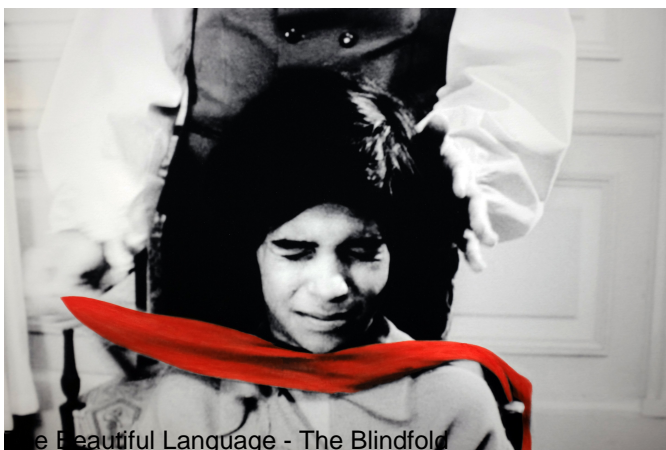
The Beautiful Language - The Blindfold

The Beautiful Language draws up an inventory of the notable elements in the context of teaching by creating image stills and coloration effects. The images show different stages in the doctor's teaching and the young boy's learning and highlight the attitudes of the characters in this educational context, where they become "student" and "teacher". The teaching shown in the images mostly consists in psychomotor tests and logic experiments.