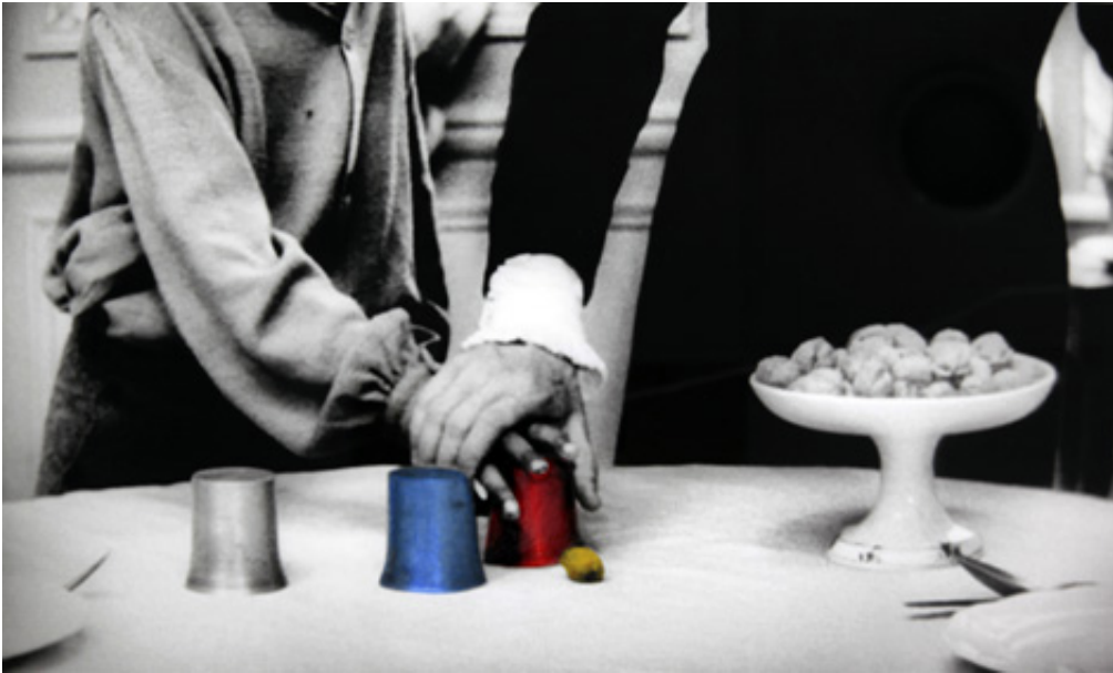
The Game, 2012, Series of 9 prints on baryta, hand-painted intervention, 40 x 50 cm View from Suspect Language, Goodman Gallery, 2012, Cape Town. Ed. of 5 + 2 A.P.

L'œuvre photographique The Beautiful language présente six séries de photographies en noir et blanc portant chacune un titre : "Le Jeu", "Le Bandeau", "La Crise", "La Punition", "Le Piège" et enfin "La Naissance". Les images en noir et blanc sont extraites du film L'Enfant sauvage de Truffaut (1970) qui s'inspire de l'histoire vraie d'un enfant non civilisé et ne possédant pas le langage qui se voit un jour capturé par des paysans au 18 e siècle, puis recueilli par un médecin qui l'étudie et fait son éducation. Les images comportent des éléments colorisés et donnent également à voir des motifs calligraphiques en surimpression, occultant partiellement la scène et les personnages présents.