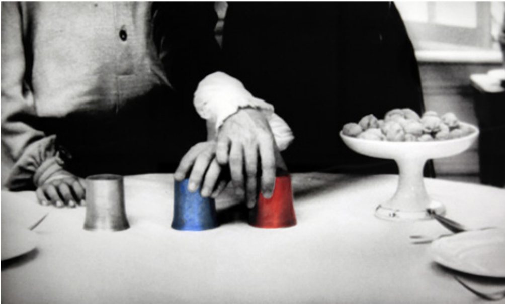
The Game, 2012, Series of 9 prints on baryta, hand-painted intervention, 40 x 50 cm View from Suspect Language, Goodman Gallery, 2012, Cape Town. Ed. of 5 + 2 A.P.

L'œuvre photographique The Beautiful language présente six séries de photographies en noir et blanc portant chacune un titre : "Le Jeu", "Le Bandeau", "La Crise", "La Punition", "Le Piège" et enfin "La Naissance". Les images en noir et blanc sont extraites du film L'Enfant sauvage de Truffaut (1970) qui s'inspire de l'histoire vraie d'un enfant non civilisé et ne possédant pas le langage qui se voit un jour capturé par des paysans au 18 e siècle, puis recueilli par un médecin qui l'étudie et fait son éducation. Les images comportent des éléments colorisés et donnent également à voir des motifs calligraphiques en surimpression, occultant partiellement la scène et les personnages présents.