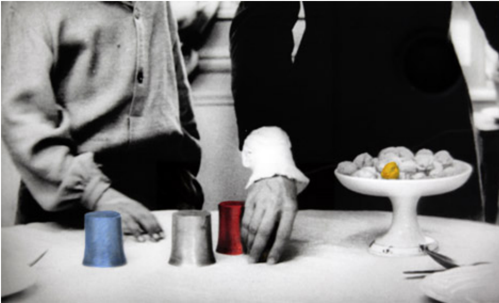
The Game, 2012, Series of 9 prints on baryta, hand-painted intervention, 40 x 50 cm View from Suspect Language, Goodman Gallery, 2012, Cape Town. Ed. of 5 + 2 A.P.

L'œuvre photographique The Beautiful language présente six séries de photographies en noir et blanc portant chacune un titre : "Le Jeu", "Le Bandeau", "La Crise", "La Punition", "Le Piège" et enfin "La Naissance". Les images en noir et blanc sont extraites du film L'Enfant sauvage de Truffaut (1970) qui s'inspire de l'histoire vraie d'un enfant non civilisé et ne possédant pas le langage qui se voit un jour capturé par des paysans au 18 e siècle, puis recueilli par un médecin qui l'étudie et fait son éducation. Les images comportent des éléments colorisés et donnent également à voir des motifs calligraphiques en surimpression, occultant partiellement la scène et les personnages présents.