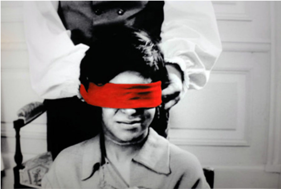
The Blindfold, 2013, series of 4 prints on baryte paper, hand-painted intervention, 40 x 50 cm. View from Suspect Language, Goodman Gallery, 2012, Cape Town. Ed. of 5 + 2 A.P.

L'œuvre photographique The Beautiful language présente six séries de photographies en noir et blanc portant chacune un titre : "Le Jeu", "Le Bandeau", "La Crise", "La Punition", "Le Piège" et enfin "La Naissance". Les images en noir et blanc sont extraites du film L'Enfant sauvage de Truffaut (1970) qui s'inspire de l'histoire vraie d'un enfant non civilisé et ne possédant pas le langage qui se voit un jour capturé par des paysans au 18e siècle, puis recueilli par un médecin qui l'étudie et fait son éducation. Les images comportent des éléments colorisés et donnent également à voir des motifs calligraphiques en surimpression, occultant partiellement la scène et les personnages présents.