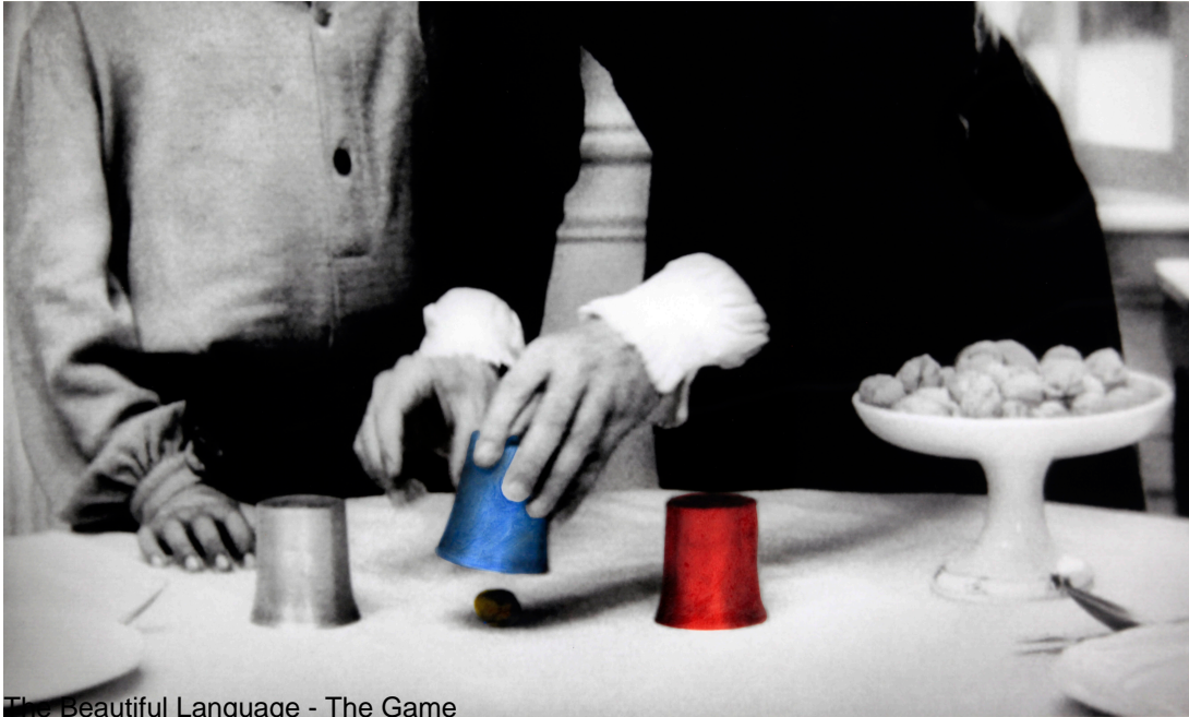
The Beautiful Language - The Game

The Beautiful Language questions education and the processes of language acquisition. The work observes the attitudes of the characters and their relations over the course of the pedagogical interaction that is depicted. In this way, it enables the exploration of notions such as “savagery” or “civilization” and the study of their relations, while evoking the question of alterity and of the perception of cultural differences in general.