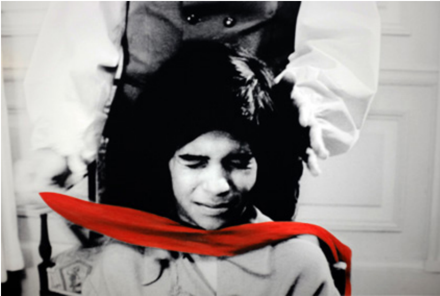
The Blindfold, 2013, series of 4 prints on baryte paper, hand-painted intervention, 40 x 50 cm. View from Suspect Language, Goodman Gallery, 2012, Cape Town. Ed. of 5 + 2 A.P.

L'œuvre photographique The Beautiful language présente six séries de photographies en noir et blanc portant chacune un titre : "Le Jeu", "Le Bandeau", "La Crise", "La Punition", "Le Piège" et enfin "La Naissance". Les images en noir et blanc sont extraites du film L'Enfant sauvage de Truffaut (1970) qui s'inspire de l'histoire vraie d'un enfant non civilisé et ne possédant pas le langage qui se voit un jour capturé par des paysans au 18 e siècle, puis recueilli par un médecin qui l'étudie et fait son éducation. Les images comportent des éléments colorisés et donnent également à voir des motifs calligraphiques en surimpression, occultant partiellement la scène et les personnages présents.