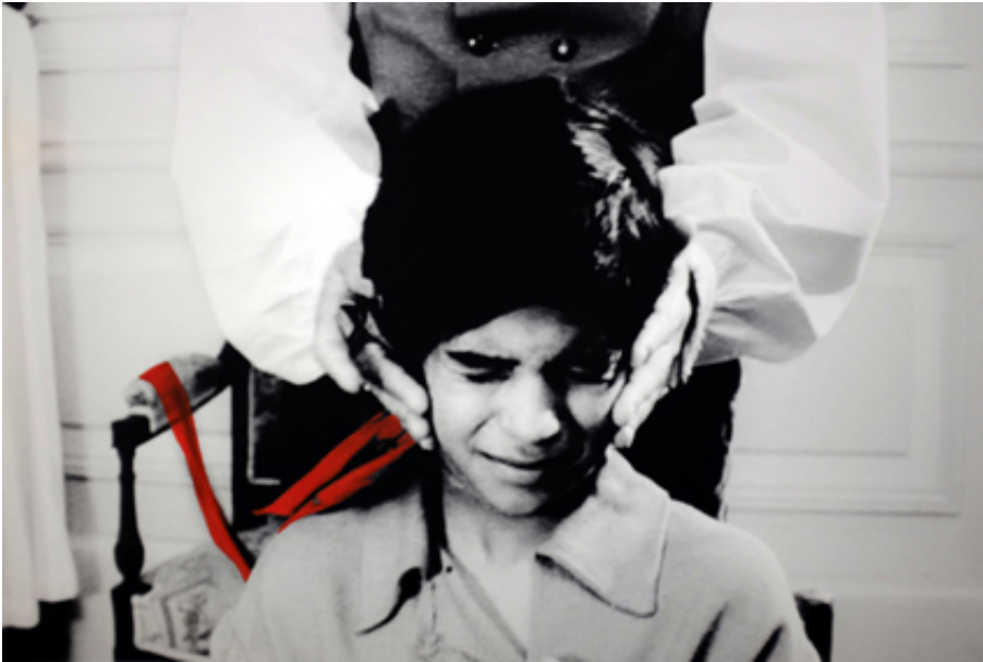
The Blindfold, 2013, series of 4 prints on baryte paper, hand-painted intervention, 40 x 50 cm. View from Suspect Language, Goodman Gallery, 2012, Cape Town. Ed. of 5 + 2 A.P.

L'œuvre photographique The Beautiful language présente six séries de photographies en noir et blanc portant chacune un titre : "Le Jeu", "Le Bandeau", "La Crise", "La Punition", "Le Piège" et enfin "La Naissance". Les images en noir et blanc sont extraites du film L'Enfant sauvage de Truffaut (1970) qui s'inspire de l'histoire vraie d'un enfant non civilisé et ne possédant pas le langage qui se voit un jour capturé par des paysans au 18 e siècle, puis recueilli par un médecin qui l'étudie et fait son éducation. Les images comportent des éléments colorisés et donnent également à voir des motifs calligraphiques en surimpression, occultant partiellement la scène et les personnages présents.