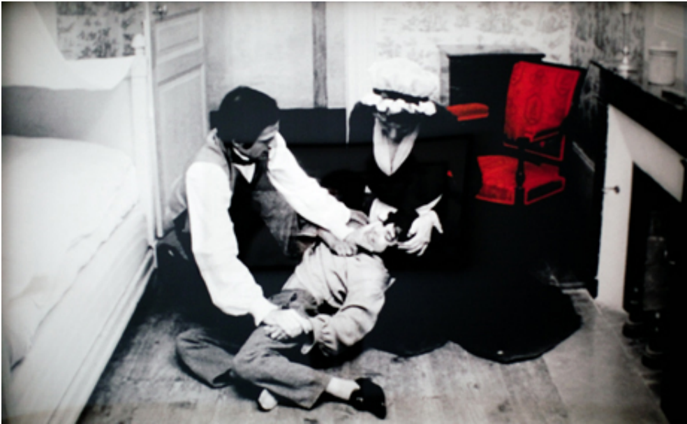
The Crisis, 2013, print on baryte paper, 109 x 180 cm. View from Suspect Language, Goodman Gallery, 2012, Cape Town. Ed. of 5 + 2 A.P.

L'œuvre photographique The Beautiful language présente six séries de photographies en noir et blanc portant chacune un titre : "Le Jeu", "Le Bandeau", "La Crise", "La Punition", "Le Piège" et enfin "La Naissance". Les images en noir et blanc sont extraites du film L'Enfant sauvage de Truffaut (1970) qui s'inspire de l'histoire vraie d'un enfant non civilisé et ne possédant pas le langage qui se voit un jour capturé par des paysans au 18 e siècle, puis recueilli par un médecin qui l'étudie et fait son éducation. Les images comportent des éléments colorisés et donnent également à voir des motifs calligraphiques en surimpression, occultant partiellement la scène et les personnages présents.