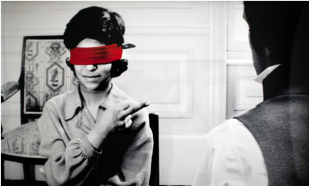
The Punishment, 2013, print on baryte paper, 109 x 180 cm. View from Suspect Language, Goodman Gallery, 2012, Cape Town. Ed. of 5 + 2 A.P.

L'œuvre photographique The Beautiful language présente six séries de photographies en noir et blanc portant chacune un titre : "Le Jeu", "Le Bandeau", "La Crise", "La Puniton", "Le Piège" et enfin "La Naissance". Les images en noir et blanc sont extraites du film L'Enfant sauvage de Truffaut (1970) qui s'inspire de l'histoire vraie d'un enfant non civilisé et ne possédant pas le langage qui se voit un jour capturé par des paysans au 18e siècle, puis recueilli par un médecin qui l'étudie et fait son éducation. Les images comportent des éléments colorisés et donnent également à voir des motifs calligraphiques en surimpression, occultant partiellement la scène et les personnages présents.