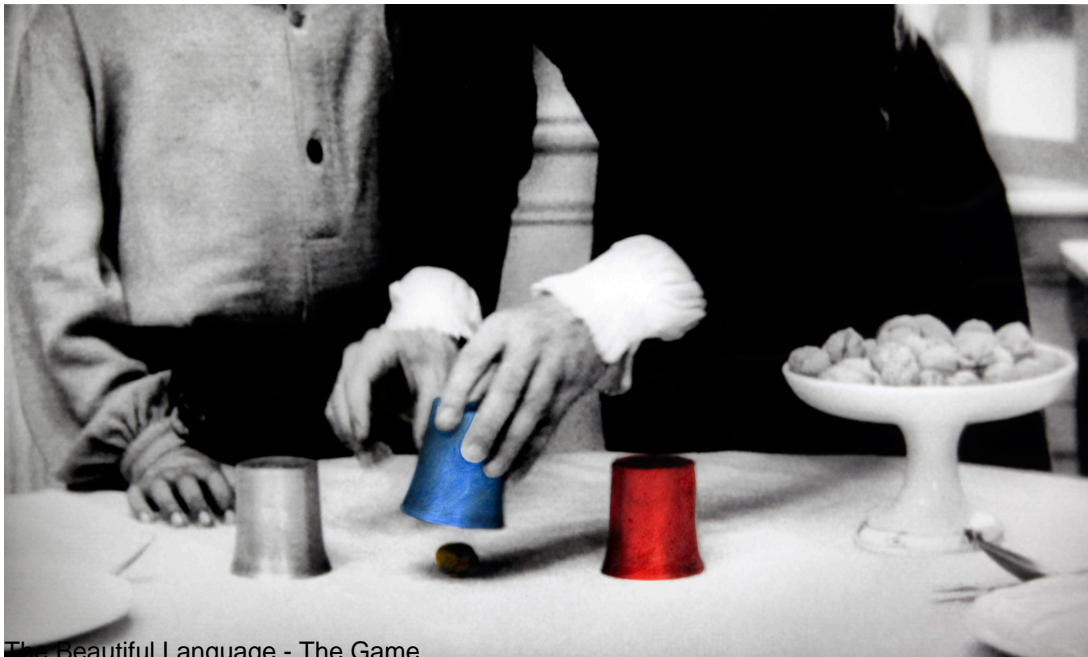
The Beautiful Language - The Game

Sharon Mizota, The Los Angeles Times, 2012