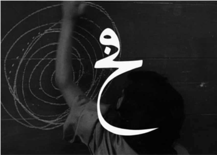
The Trap, 2013, print on baryte paper, 59,3 x 80 cm. View from Suspect Language, Goodman Gallery, 2012, Cape Town. Ed. of 5 + 2 A.P.

L'œuvre photographique The Beautiful language présente six séries de photographies en noir et blanc portant chacune un titre : "Le Jeu", "Le Bandeau", "La Crise", "La Punition", "Le Piège" et enfin "La Naissance". Les images en noir et blanc sont extraites du film L'Enfant sauvage de Truffaut (1970) qui s'inspire de l'histoire vraie d'un enfant non civilisé et ne possédant pas le langage qui se voit un jour capturé par des paysans au 18 e siècle, puis recueilli par un médecin qui l'étudie et fait son éducation. Les images comportent des éléments colorisés et donnent également à voir des motifs calligraphiques en surimpression, occultant partiellement la scène et les personnages présents.