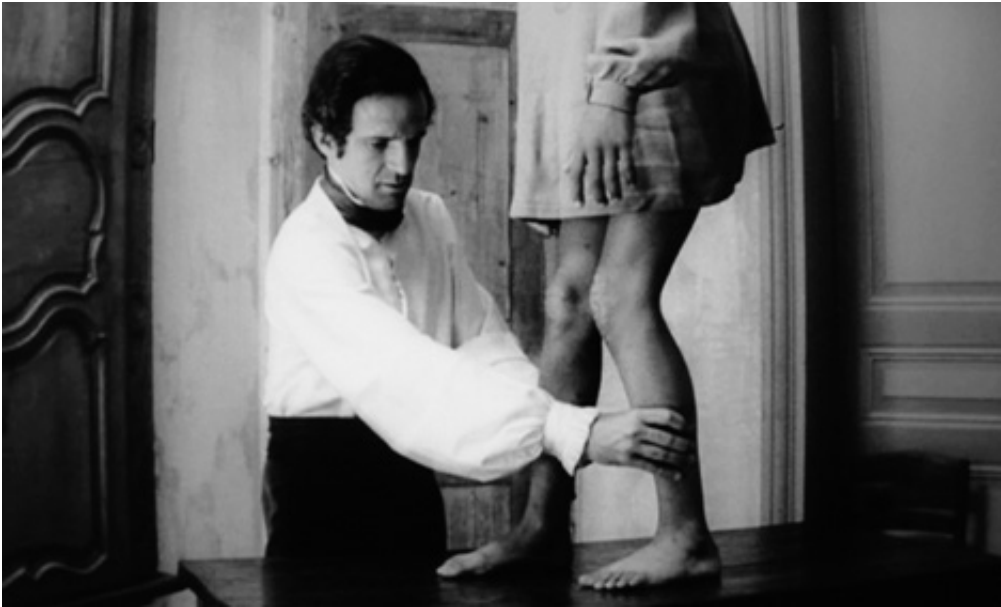
The Birth, 2013, series of 5 pigment prints on fine art, 18 x 30 cm. View from Suspect Language, Goodman Gallery, 2012, Cape Town. Ed. of 5 + 2 A.P.

L'œuvre photographique The Beautiful language présente six séries de photographies en noir et blanc portant chacune un titre : "Le Jeu", "Le Bandeau", "La Crise", "La Punition", "Le Piège" et enfin "La Naissance". Les images en noir et blanc sont extraites du film L'Enfant sauvage de Truffaut (1970) qui s'inspire de l'histoire vraie d'un enfant non civilisé et ne possédant pas le langage qui se voit un jour capturé par des paysans au 18 e siècle, puis recueilli par un médecin qui l'étudie et fait son éducation. Les images comportent des éléments colorisés et donnent également à voir des motifs calligraphiques en surimpression, occultant partiellement la scène et les personnages présents.