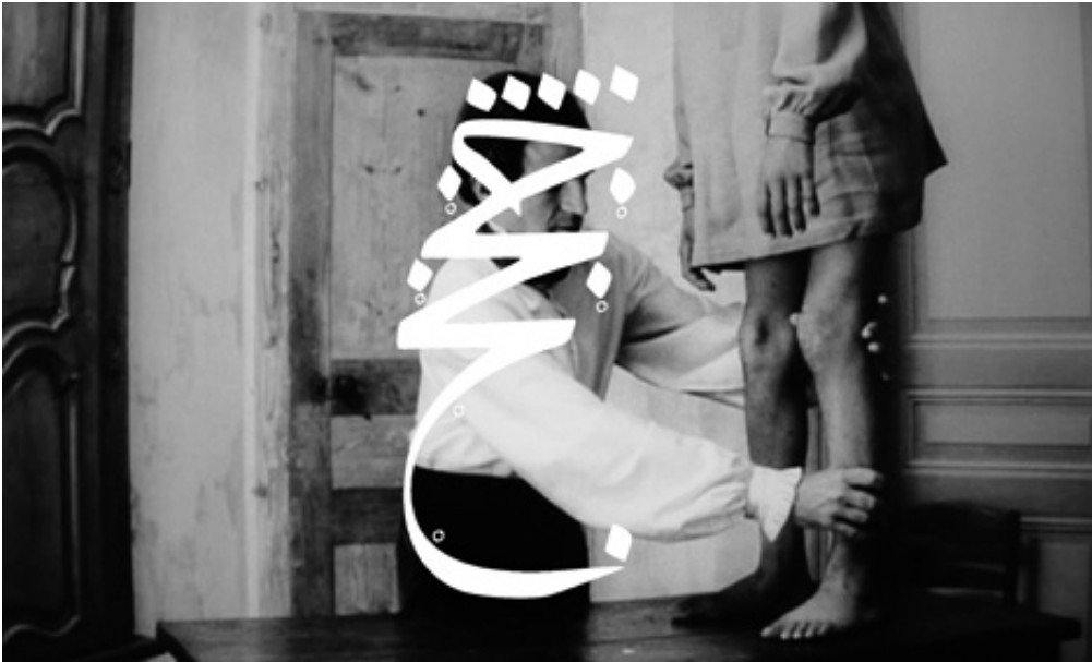
The Birth, 2013, series of 5 pigment prints on fine art, 18 x 30 cm. View from Suspect Language, Goodman Gallery, 2012, Cape Town. Ed. of 5 + 2 A.P.

L'œuvre photographique The Beautiful language présente six séries de photographies en noir et blanc portant chacune un titre : "Le Jeu", "Le Bandeau", "La Crise", "La Punition", "Le Piège" et enfin "La Naissance". Les images en noir et blanc sont extraites du film L'Enfant sauvage de Truffaut (1970) qui s'inspire de l'histoire vraie d'un enfant non civilisé et ne possédant pas le langage qui se voit un jour capturé par des paysans au 18 e siècle, puis recueilli par un médecin qui l'étudie et fait son éducation. Les images comportent des éléments colorisés et donnent également à voir des motifs calligraphiques en surimpression, occultant partiellement la scène et les personnages présents.