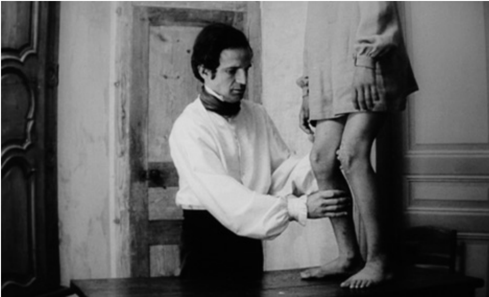
The Birth, 2013, series of 5 pigment prints on fine art, 18 x 30 cm. View from Suspect Language, Goodman Gallery, 2012, Cape Town. Ed. of 5 + 2 A.P.

L'œuvre photographique The Beautiful language présente six séries de photographies en noir et blanc portant chacune un titre : "Le Jeu", "Le Bandeau", "La Crise", "La Punition", "Le Piège" et enfin "La Naissance". Les images en noir et blanc sont extraites du film L'Enfant sauvage de Truffaut (1970) qui s'inspire de l'histoire vraie d'un enfant non civilisé et ne possédant pas le langage qui se voit un jour capturé par des paysans au 18 e siècle, puis recueilli par un médecin qui l'étudie et fait son éducation. Les images comportent des éléments colorisés et donnent également à voir des motifs calligraphiques en surimpression, occultant partiellement la scène et les personnages présents.