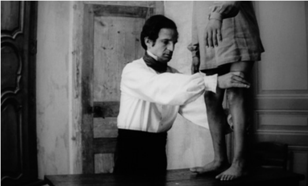
The Birth, 2013, series of 5 pigment prints on fine art, 18 x 30 cm. View from Suspect Language, Goodman Gallery, 2012, Cape Town. Ed. of 5 + 2 A.P.

L'œuvre photographique The Beautiful language présente six séries de photographies en noir et blanc portant chacune un titre : "Le Jeu", "Le Bandeau", "La Crise", "La Punition", "Le Piège" et enfin "La Naissance". Les images en noir et blanc sont extraites du film L'Enfant sauvage de Truffaut (1970) qui s'inspire de l'histoire vraie d'un enfant non civilisé et ne possédant pas le langage qui se voit un jour capturé par des paysans au 18e siècle, puis recueilli par un médecin qui l'étudie et fait son éducation. Les images comportent des éléments colorisés et donnent également à voir des motifs calligraphiques en surimpression, occultant partiellement la scène et les personnages présents.