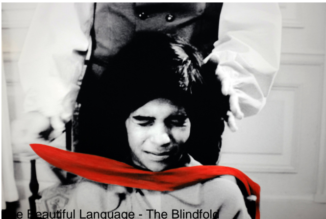
The Beautiful Language - The Blindfold

The Beautiful Language draws up an inventory of the notable elements in the context of teaching by creating image stills and coloration effects. The images show different stages in the doctor's teaching and the young boy's learning and highlight the attitudes of the characters in this educational context, where they become "student" and "teacher". The teaching shown in the images mostly consists in psychomotor tests and logic experiments.