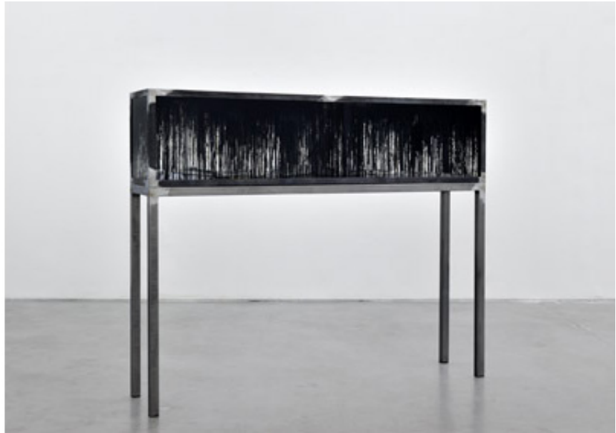
2013, 176 x 36 x 153,5 cm, case in glass and steel, sacred books, ink. Exhibition view from They were blind, they only saw images , Galerie Yvon Lambert, 2014, Paris.