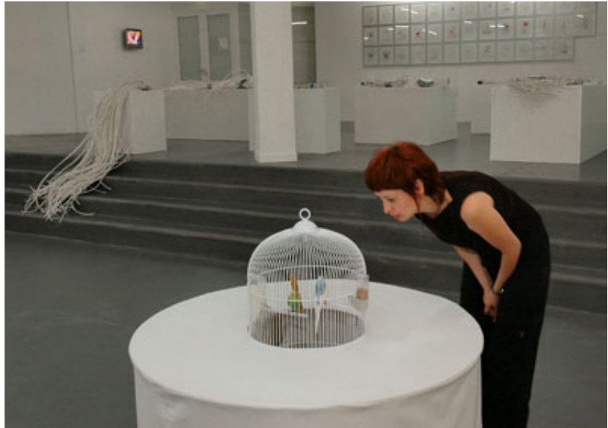
2001-2004, mixed media, sound installation, video transmission, size may vary. Exhibition view of Comprendra bien qui comprendra le dernier , Le Parvis, 2004, Ibos. Courtesy of the artist and Ceysson & Bénétière, Paris. Ed. of 5 + 1 A.P.

Le langage des oiseaux est une installation qui se déroule simultanément dans les différentes pièces d'un même espace d'exposition. Une première salle fait apparaître une petite table ronde recouverte d'une nappe blanche, au centre de laquelle est disposée une cage de la même couleur et abritant des oiseaux. Seule la moitié supérieure de la cage dépasse de la table, la moitié inférieure disparaissant sous celle-ci, ce qui oblige les spectateurs à s'avancer afin d'en voir le contenu. Dans le fond de la cage est placée une caméra de surveillance connectée à un projecteur situé dans une autre salle, éloignée de la première, qui retransmet des images des visages des spectateurs se penchant au-dessus de la table. Les images sont projetées sur un écran géant et soumises à l'attention d'une autre partie du public venu visiter l'installation. Une bande sonore composée de chants d'oiseaux est diffusée dans tout les lieux où les spectateurs évoluent.