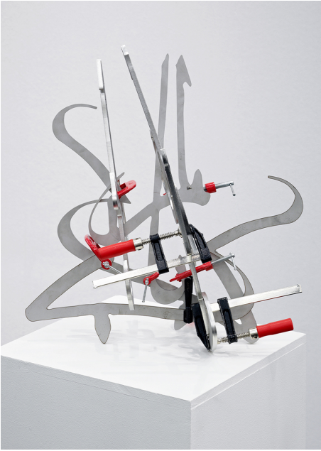
Calligraphy of Fire