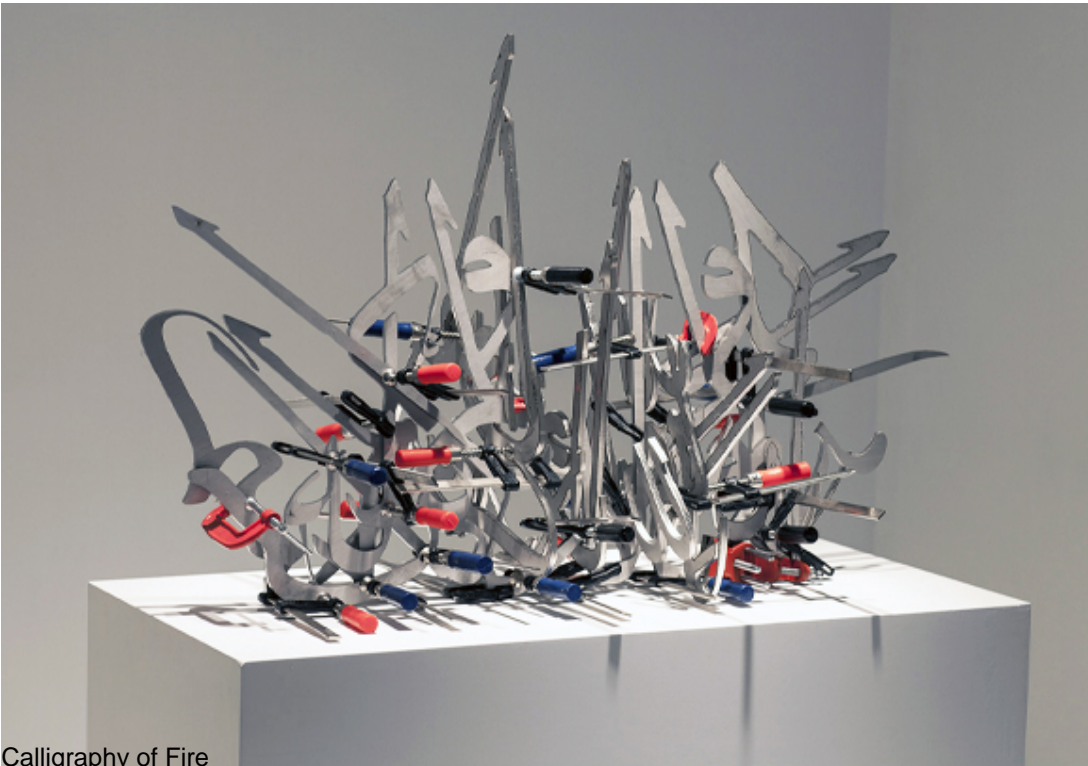
Calligraphy of Fire