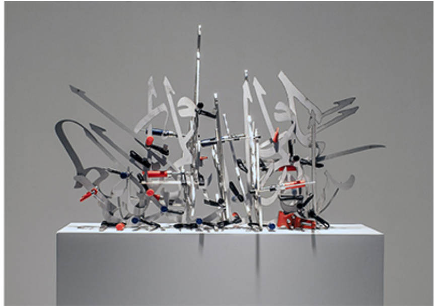
2012-2016 Steel, clamps Exhibition view from A Savage Mind, Keitelman Gallery, 2016, Brussels. Courtesy of the artist and Ceysson & Bénétière, Paris.

Calligraphie de feu est une série sculpturale montrant des phrases déconstruites. Des calligraphies arabes découpées dans des plaques de métal tenues par des pinces et prises en étau, prennent la forme de flammes. Cette série se développe en deux formes distinctes. La première, plus ramassée, rappelle nettement la forme d'une seule flamme. La seconde, plus développée, évoque la structure d'une phrase comme une flambée suivant son propre cheminement.