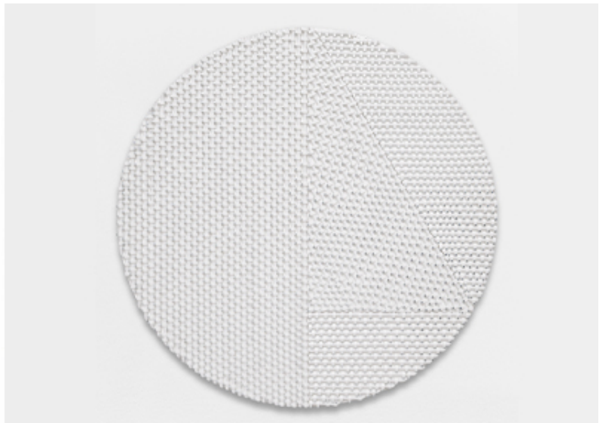
2019, coaxial antenna cable on plywood, plexiglass, diameter of 70 cm.

Les Cercles, avec leur aspect blanc immaculé et épuré, leur jeu d'associations des formes, de tensions entre lignes droites et courbes, de révélation et d'occultation des figures, attirent le regard autant qu'ils soulèvent de questions. La série des Cercles est réalisée au moyen de câbles d'antennes blancs - matériau récurrent des œuvres de Mounir Fatmi depuis 1998, disposés en motifs géométriques, puis fixés à des panneaux blancs et circulaires à l'aide d'attaches à tête rondes. Les compositions obtenues sont parfois surmontées d'un second panneau circulaire blanc en plexiglas, découpé à certains endroits, et laissant apparaître les câbles coaxiaux.