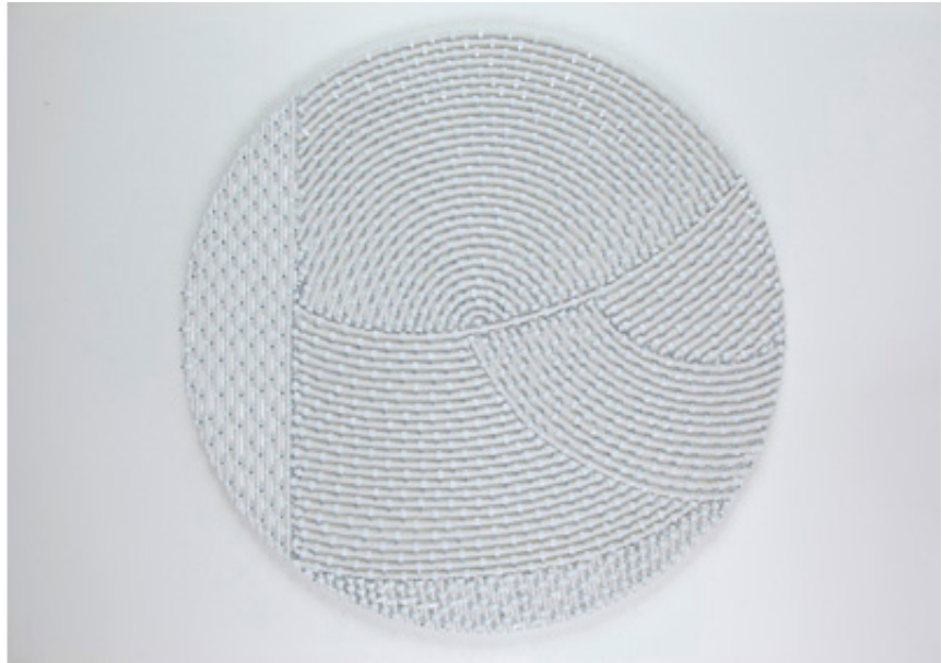
2011, coaxial antenna cable, staples on plywood, 69 cm. Exhibition view from Abu Dhabi Art, Ceysson & Benetiere, 2017, Abu Dhabi.

Les Cercles, avec leur aspect blanc immaculé et épuré, leur jeu d'associations des formes, de tensions entre lignes droites et courbes, de révélation et d'occultation des figures, attirent le regard autant qu'ils soulèvent de questions. La série des Cercles est réalisée au moyen de câbles d'antennes blancs - matériau récurrent des œuvres de Mounir Fatmi depuis 1998, disposés en motifs géométriques, puis fixés à des panneaux blancs et circulaires à l'aide d'attaches à tête rondes. Les compositions obtenues sont parfois surmontées d'un second panneau circulaire blanc en plexiglas, découpé à certains endroits, et laissant apparaître les câbles coaxiaux.