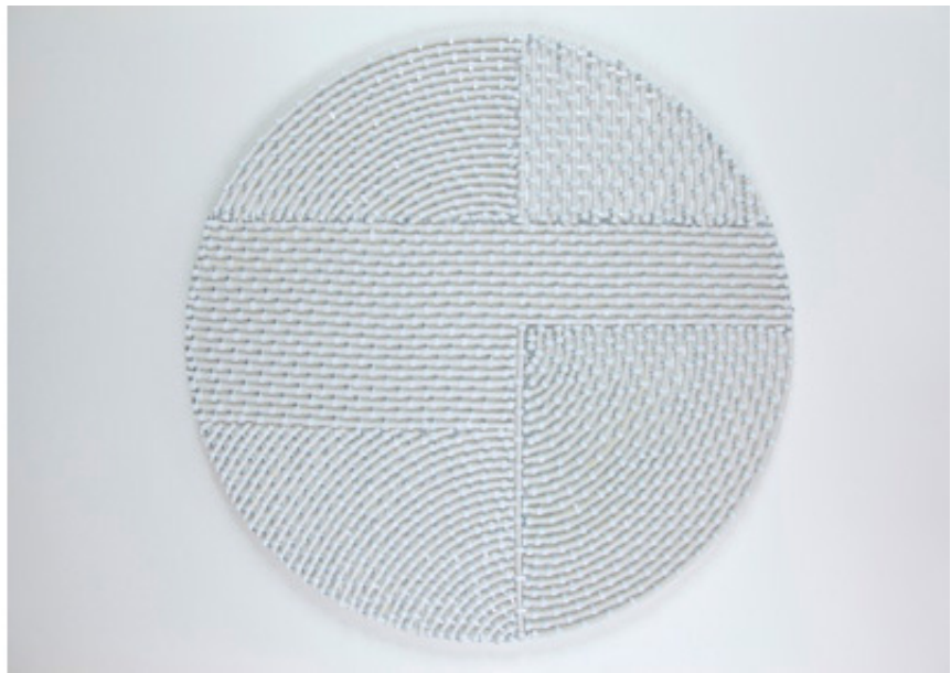
2011, coaxial antenna cable, staples on plywood, 69 cm.

Les Cercles, avec leur aspect blanc immaculé et épuré, leur jeu d'associations des formes, de tensions entre lignes droites et courbes, de révélation et d'occultation des figures, attirent le regard autant qu'ils soulèvent de questions. La série des Cercles est réalisée au moyen de câbles d'antennes blancs - matériau récurrent des œuvres de Mounir Fatmi depuis 1998, disposés en motifs géométriques, puis fixés à des panneaux blancs et circulaires à l'aide d'attaches à tête rondes. Les compositions obtenues sont parfois surmontées d'un second panneau circulaire blanc en plexiglas, découpé à certains endroits, et laissant apparaître les câbles coaxiaux.