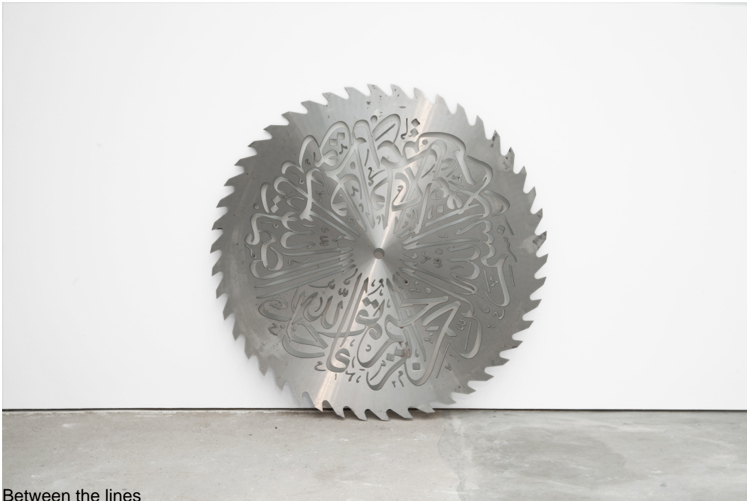
Between the lines

The expression designating the piece, with both its literal and figurative meanings, seems to call upon the viewer's cognitive and linguistic capacities. It beckons him to read "between the lines", to guess significations that are not formulated in an explicit way.