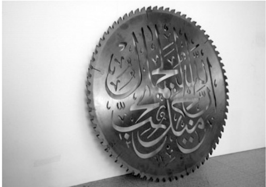
2010, saw blade in steel, 50 cm. Exhibition view from Art Brussels, Galerie Conrads, 2010, Brussels. Courtesy of the artist and Ceysson & Bénétière, Paris. Ed. of 5 + 1 A.P.

Lame de scie circulaire aux dimensions impressionnantes et aux grandes dents acérées, Entre les Lignes s'ornemente à sa surface de motifs calligraphiques en arabe classique découpés avec précision dans un acier poli aux reflets étincelants. Les écritures stylisées renvoient à la sourate 112 du Coran, intitulée "Al-Ilkhas" ("La Purification"), qui affirme la transcendance de Dieu (Al-Tawhid) et évoque également son témoignage par le croyant : " Dis : « Lui , Allah, l'Unique / Allah, le Numineux / Il n'enfante pas et n'est pas enfanté / Il n'a pas d'égal ! » "