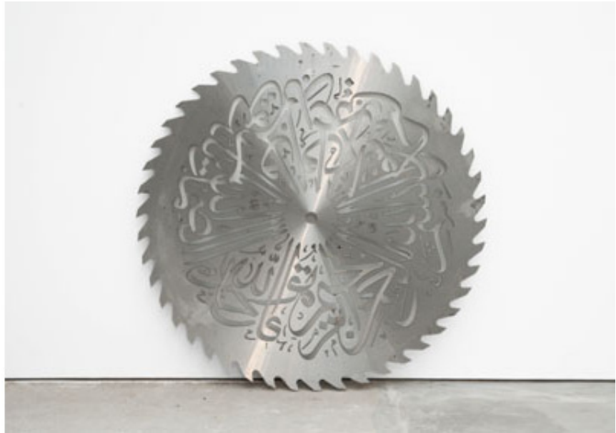
2010, saw blade in steel, 150 cm. Exhibition view from The Storyteller , Art Gallery of Ontario, 2010, Toronto. Ed. of 5 + 1 A.P.