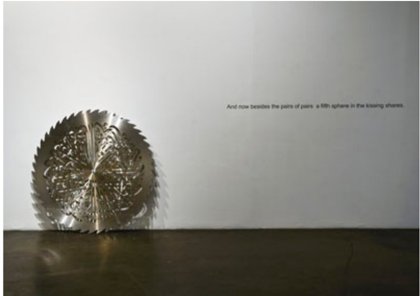
2010, saw blade in steel, 150 cm. Exhibition view from Kissing Circles, Shoshana Wayne Gallery, 2012, Santa Monica. Ed. of 5 + 1 A.P.