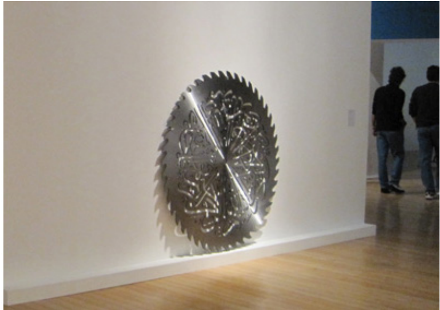
2010, saw blade in steel, 150 cm. Exhibition view from Miragen, Centro Cultural Banco do Brasil, 2010, Rio de Janeiro. Ed. of 5 + 1 A.P.