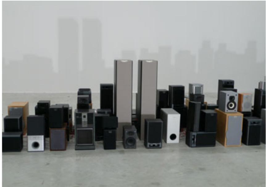
2007, Sound architecture, speakers, soundtrack, light and shadow, 500 x 250 x 100 cm. Exhibition view of 52ème Biennale de Venise, 2007, Venise. Ed. of 5 + 1 A.P.