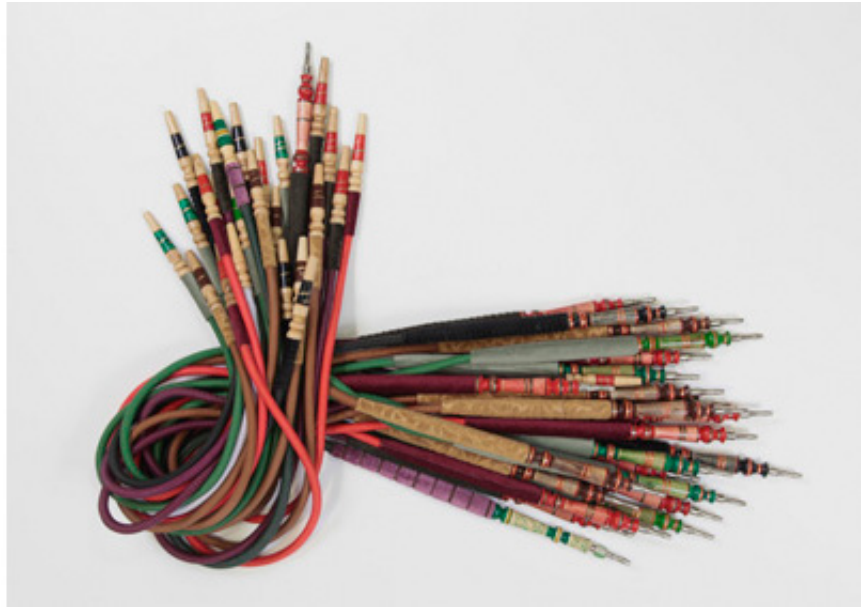
2011, hookas, 73 x 91 x 15 cm on pedestal of 150 x 130 cm, 20 cm high. Ed. of 5 + 1 A.P.

Le pouvoir des mots est un fait constaté. On ne cessera jamais d'être surpris par l'incroyable flexibilité du langage, témoin d'une histoire de fusions, influences et évolutions consécutives, aussi riches que celle ayant formé le genre humain. Se pencher sur la parenté des mots serait un exercice égal à la chasse aux trésors où les faits de société révèlent leur dessous.