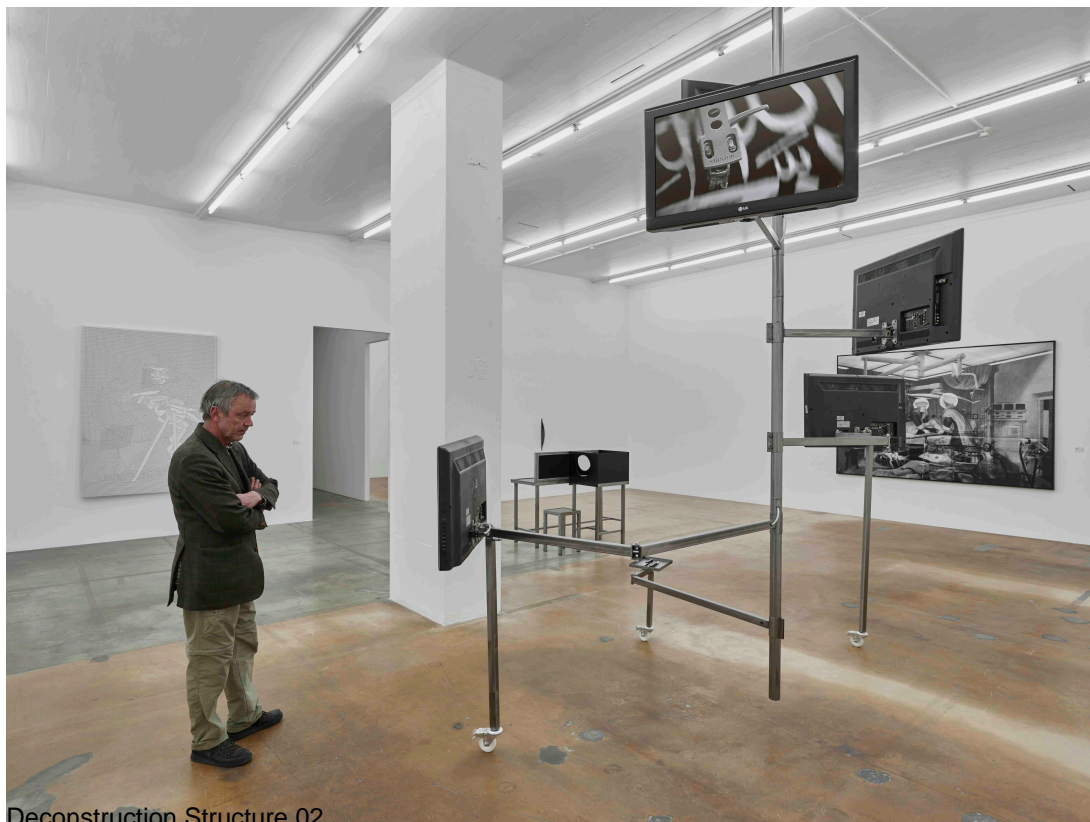
Deconstruction Structure 02

The Deconstruction Structure project comprises several installations, a series of mobile metallic constructions with different shapes. The structures are fitted with wheels and have several arms with television screens or loudspeakers at their ends, showing or playing works by mounir fatmi, as well as objects taken from old or recent pieces belonging to various media, sculptures, installations or performances.