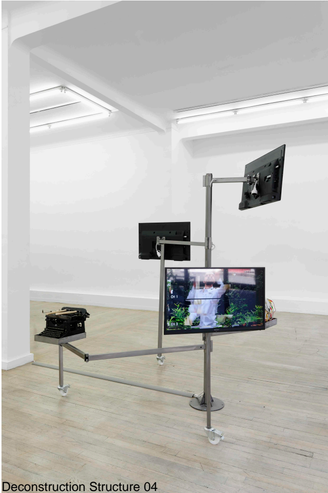
Deconstruction Structure 04

In a way, the series of installations presents sensitive structures whose mobile, moving and changing geometries express the wish for a constantly renewed relation to the world and artistic activity.