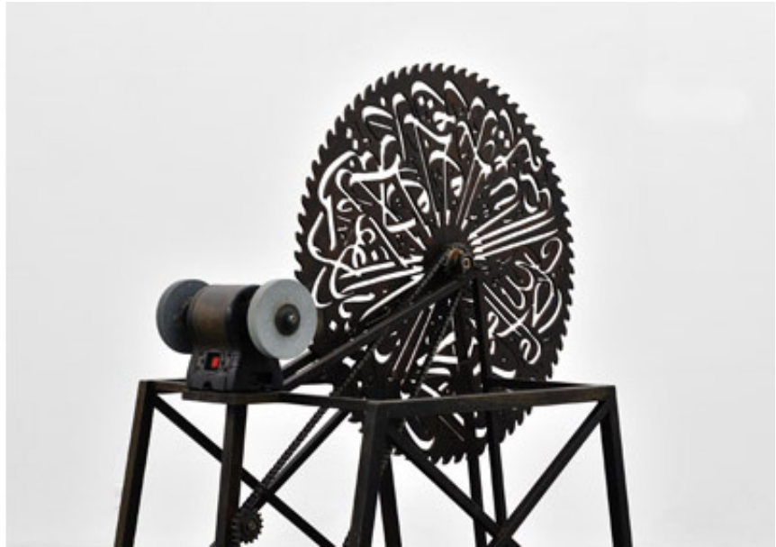
2013, Machine in steel, arabic calligraphy, engine, 75 x 100 x 116 cm. Exhibition view of They were blind, they only saw images, Yvon Lambert, 2014, Paris. Ed. of 5 + 1 A.P.

Le Paradoxe est une œuvre sculpturale de mounir fatmi composée d'une machine à remouler obsolète et d'une lame de scie circulaire sur laquelle sont découpées des versets coraniques en langue arabe classique. Louant l'unicité de Dieu dans l'Islam, ces versets dispersés à la surface de la lame s'opposent à la Trinité chrétienne où subsiste une dimension humaine, celle du fils. Des éclats de ce même verset calligraphié sont dispersés autour de la machine, comme échappés de la surface de la lame. Cet effet est accentué lors de la mise en branle de la machine par un performeur, qui tente d'affûter ces bribes de texte sacré et continuer à alimenter la machine. De ce geste, l'homme décharge le texte symbolisé par ces objets de toute valeur religieuse.