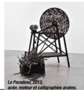
Le Paradoxe, 2013, acier, moteur et calligraphies arabes.

© Mounir Fatmi, courtesy de l'artiste et Goodman Gallery, Johannesburg-Cape Town