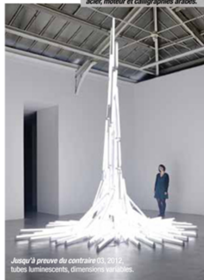
Jusqu'à preuve du contraire 03, 2012, tubes luminescents, dimensions variables.