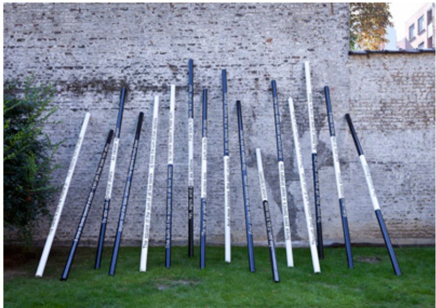
2013, 16 jumping poles, 4 meters high. Exhibition view of Intersections , Keitelman Gallery, 2013, Brussels. Ed. of 1 + 1 A.P.

Installation réalisée en 2013, Le Baiser précis attire le spectateur au moyen d'un dispositif sculptural composé de barres de saut hippique et de peinture d'extraits de poème. L'installation donne à voir 16 barres d'obstacle longues de 4 mètres chacune, dont une extrémité repose au sol, tandis que l'autre est appuyée contre un mur, selon différents angles. Les barres sont peintes en noir et blanc et recouvertes d'inscriptions tirées du poème "The Kiss precise" du mathématicien et prix Nobel de chimie Soddy, œuvre littéraire inspirée du théorème de Descartes sur les cercles tangents.