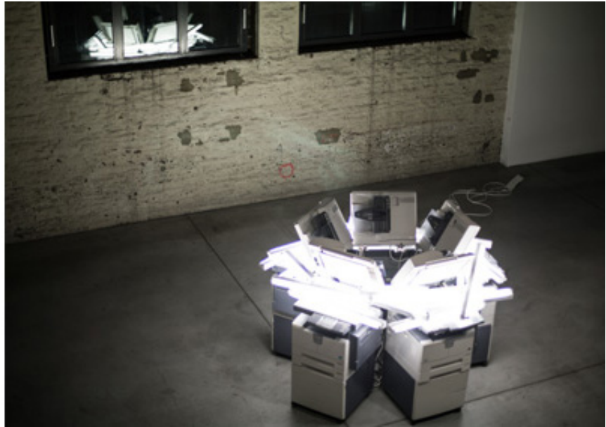
2009-2011, five copy machines, neon lights. Exhibition view of Intranquillités , B.P.S.22, 2012, Charleroi. Courtesy of the artist and Art Front Gallery, Tokyo. Ed. of 5 + 1 A.P.

This work was part of 6th Manif d'art Biennial -Machines - Les Formes du mouvement, Québec, 2012.