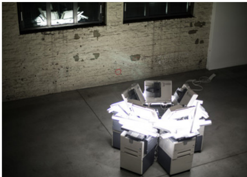
2009-2011, five copy machines, neon lights. Exhibition view of Intranquillités , B.P.S.22, 2012, Charleroi. Courtesy of the artist and Art Front Gallery, Tokyo. Ed. of 5 + 1 A.P.

This work was part of 6th Manif d'art Biennial -Machines - Les Formes du mouvement, Québec, 2012.