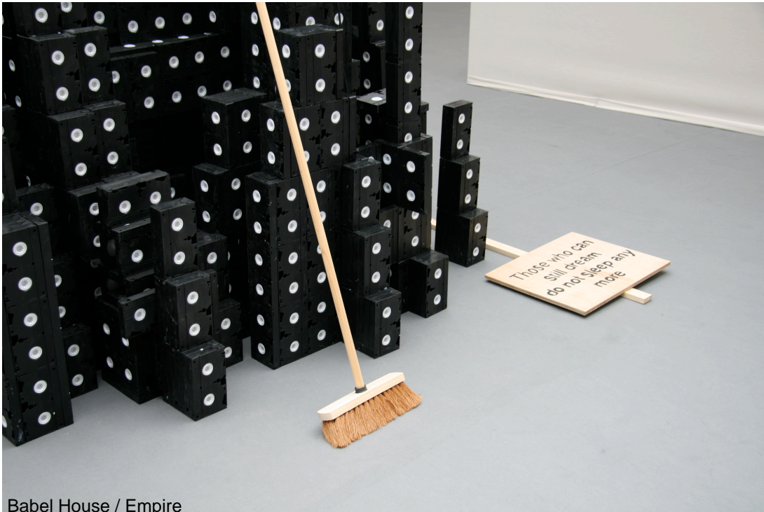
Babel House / Empire

Babel House/Empire can, in the first instance, be understood as a sort of schematic proposition, within an evocative body of work. A sign of men's excessive pride and a form of vanity, this video tape construction, where each tape can be seen as one of the bricks hardened in the fires of Genesis, fuels the feeling that it could collapse at any minute.