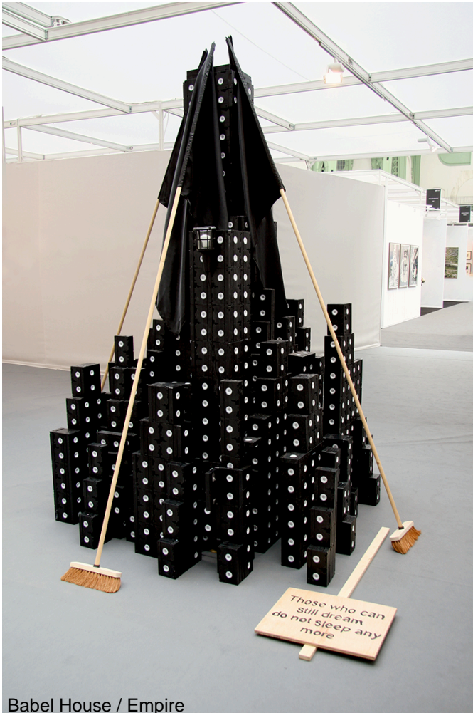
Babel House / Empire