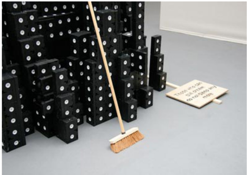
2008, VHS, brooms, black flags, wood panel, lights, around 150 x 150 x 300 cm. Exhibition view of Traversées, Le Grand Palais, 2008, Paris. Ed. of 1 + 1 A.P.

Construction sculpturale- architecturale de cassettes VHS et de balais dont les manches se font hampes de drapeau, Babel House/Empire se présente d'abord comme une évocation de New York et de l'emblématique Empire State Building, qui depuis le 09.11, est redevenu, pour un moment encore indéterminé, la plus haute tour de la ville. Mounir fatmi poursuit ici son interrogation sur l'architecture, la ville, le sens idéologique insufflé dans ses options architecturales, déjà engagée dans plusieurs œuvres.*