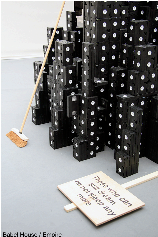
Babel House / Empire

The black flags, which could be interpreted as symbols of cynicism rather than anarchy (although this sometimes comes down to the same thing), are there to sweep away what meaning is left, reducing the remains of ideologies to dust.