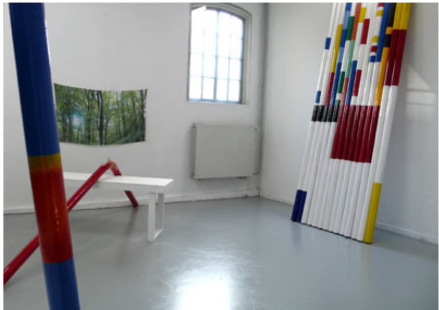
2007, 14 jumping poles, 3 neons, 400 x 150 cm. Exhibition view of In search of paradise , Galerie Ferdinand van Dieten, 2007, Amsterdam. Ed. of 5 + 1 A.P.

Cette installation présentée pour la première fois dans le cadre de l'exposition « In search of paradise » à la Galerie Ferdinand Van Dieten en même temps qu'à la Rijksakademie à Amsterdam, aux Pays-Bas, constitue une première proposition d'un dispositif appelé à se développer ultérieurement dans d'autres configurations.