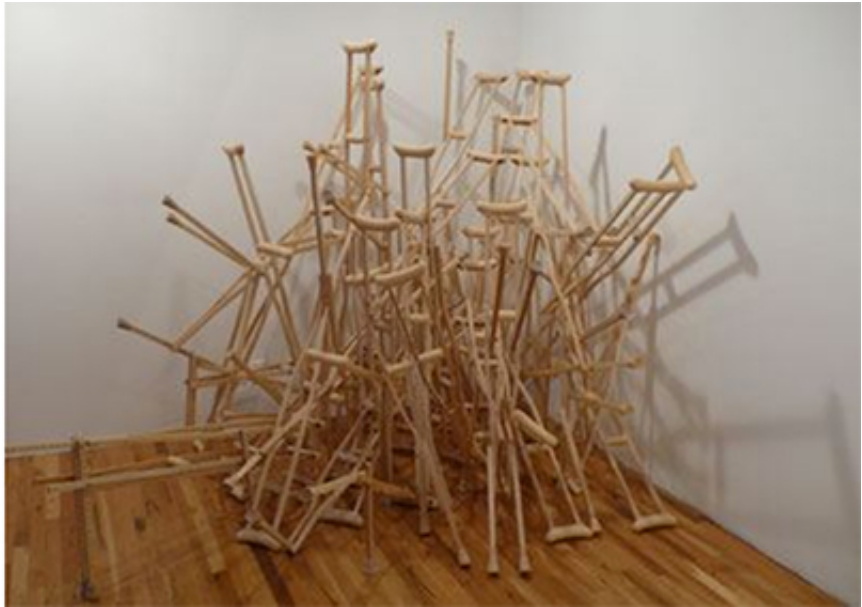
2007, wood crutches, size may vary. Exhibition view of Fuck architects : chapter I, Lombard-Freid projects, 2007, New-York. Ed. of 1 + 1 A.P.

Cette installation, comme la plupart des œuvres de mounir fatmi, se déploie dans une axiologie rhizomatique. A première vue, Double stratégie ne pourrait être qu'un fatras de béquilles abandonnées dans un coin. Et d'emblée, l'installation dégage une sorte d'inquiétude, de malaise diffus au travers de ces objets qui suggèrent la maladie, la souffrance, le handicap. Trouble qu'il nous faudra apprivoiser pour dépasser le premier degré d'approche.