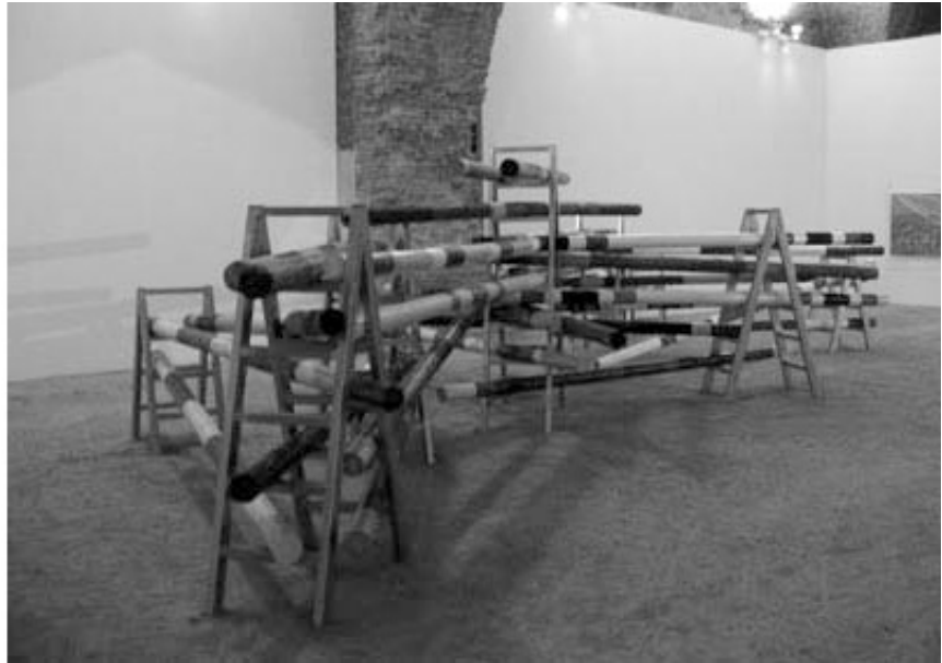
2006, 50 jumping poles, painting, ladders in metal, size may vary. Exhibition view of 2nd Seville Biennial, 2006, Seville. Ed. of 1 + 1 A.P.

This work was part of 2nd Seville Biennale, Seville, 2006.