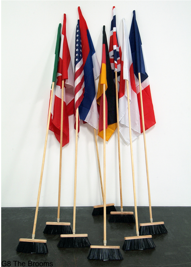
G8 The Brooms

Consolidating his complete oeuvre in the primacy of the mental adequacy of signifieds and signifiers, mounir fatmi makes his piece G8 – the brooms a continuum between territory, identity, borders, history, society, politics, human relations, balances of power, object, domination, man, woman, home, intimacy, sex, life and death.