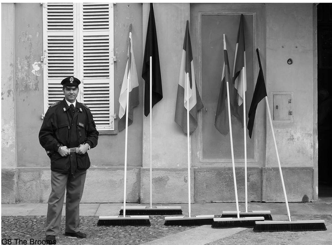
G8 The Brooms

The combination of two objects is a way of allowing a mental back and forth between the public and private spheres. The intimate,