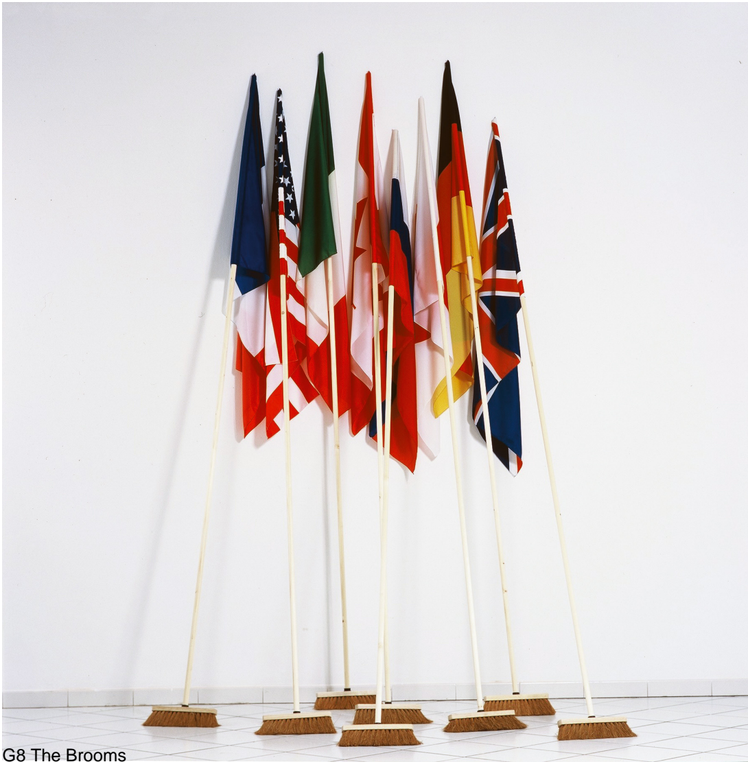
G8 The Brooms

Along the wall, eight brooms are lined up next to each other. The brush of each broom, brought forward slightly, gives the installation an air of instability. The eight brushes form a lozenge on the ground, echoing the form of the coloured pieces of fabric placed at the top of each broom pole. The colours of the fabric are not atonal as their different compositions resemble the American, Japanese, English, French, Italian, Canadian and Russian flags.