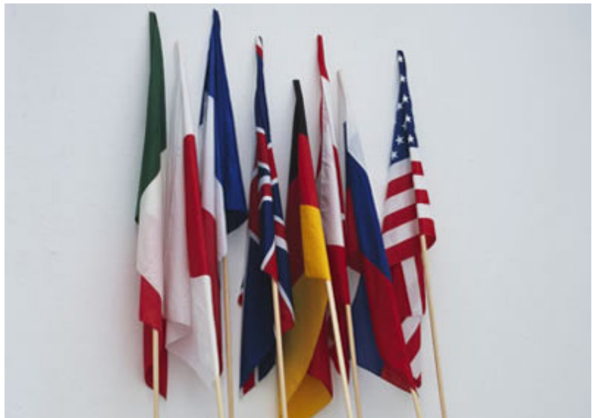
2004, 8 brooms, flags, 3 meters high, size may vary. Exhibition view of Shard history/Decolonising the image , Espace Arti, 2006, Amsterdam. Ed. of 5 + 1 A.P.