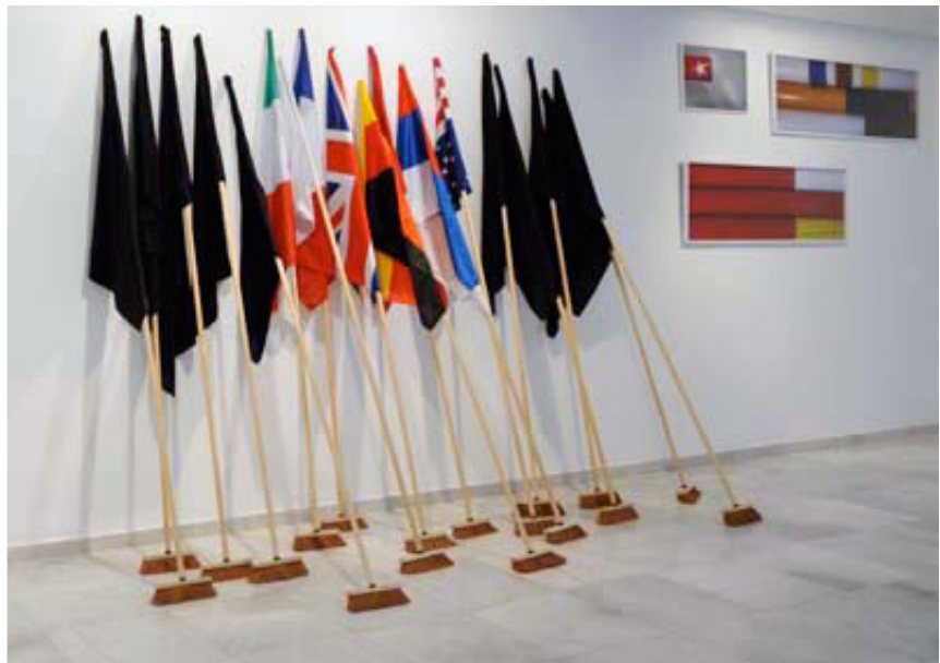
2004, 18 brooms, flags, 3 meters high, size may vary. Exhibition view of Traversia, CAAM, 2008, îles Canaries. Ed. of 5 + 1 A.P.