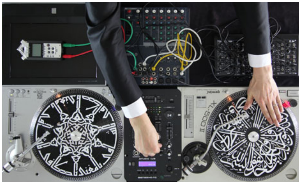
2010-2011, diptych, prints on Duratrans, lightboxes, 65 x 110 cm each one. Courtesy of the artist and Ceysson & Bénétière, Paris. Ed. of 5 + 2 A.P.

« Mixology » est un diptyque photographique en couleurs dont le cadre est formé par une table de mixage de DJ, appareil qui permet de mélanger plusieurs sources audio. La console, à la fois digitale et analogique, se compose de platines vinyles ornées de calligraphies arabes cursives et coufiques reprenant des versets religieux, et d'instruments numériques divers : amplificateurs, microphones et commutateurs. Reliant tous ces éléments entre eux, des fils électriques multicolores traversent l'image latéralement en décrivant des boucles, qui superposent les unes aux autres, tandis que du cadre supérieur de l'image surgit une paire de bras qui les manipule.