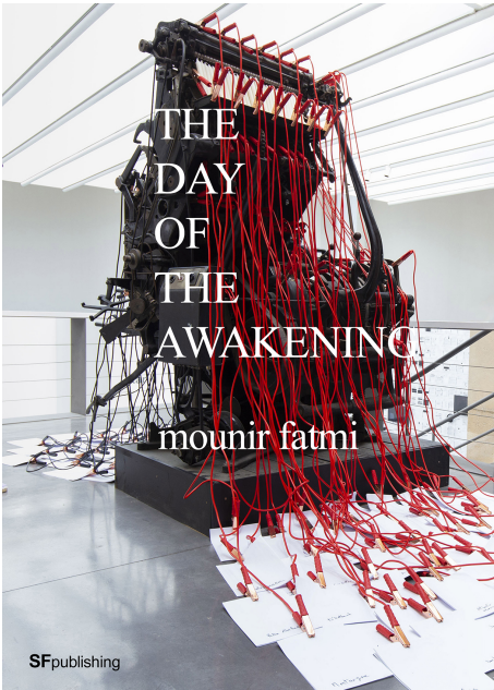
The Day of the Awakening, SF Publishing, 2019

The Day of the Awakening is inspired by the title of an installation by mounir fatmi. Its epigraph, simple and enigmatic, acts as a metaphor for an artistic work that constructs visual spaces and linguistic games. In this way, his work offers a view of the world from a different perspective, avoiding the blindness provided by conventions.