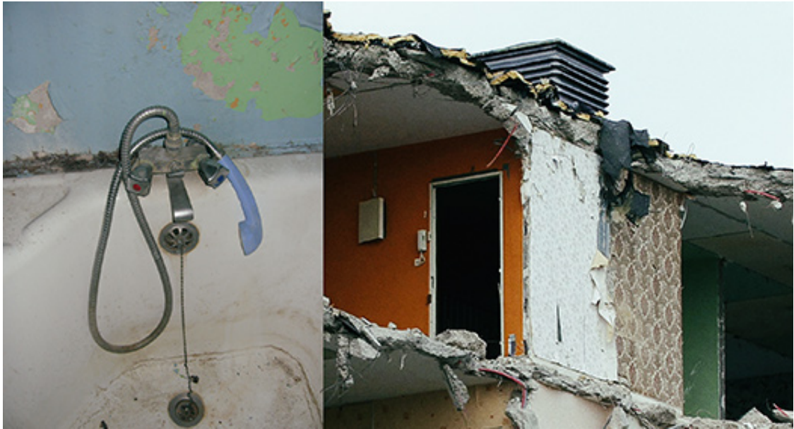
2010, Series of 38 photos, C-Print, 27 x 50 cm each. Exhibition view from Pavillon de L'exil, Galerie Delacroix, 2017, Tanger. Ed. of 5 + 2 A.P.

This work was part of 5th Setouchi Triennale, Awashima, 2022.