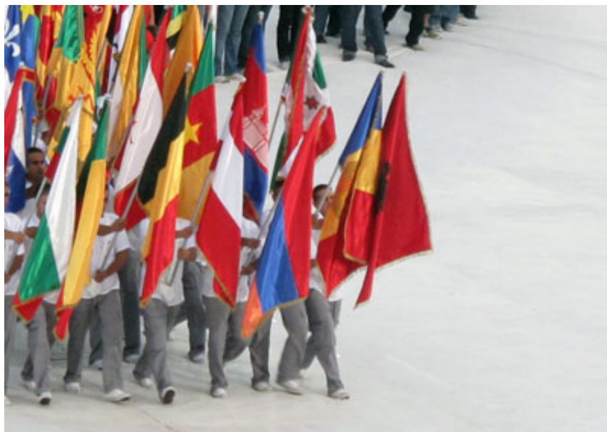
2010, inkjet prints, serie of 4 photographs, 50 x 75 cm each. Ed. of 5 + 2 A.P.

La série photographique en couleurs « Porte-drapeau » restitue les images d'une cérémonie officielle. Des jeunes hommes vêtus de manière identique, en pantalon blanc et chemise blanche, marchent en groupe en tenant dans leurs mains les bannières de pays divers. Drapeaux et porte-drapeaux, en grand nombre, se mêlent et disparaissent les uns derrière les autres. L'œuvre interroge les concepts de nation et de nationalité. Elle étudie les expressions du nationalisme par les états et décrit le paysage géopolitique internationale constitué par leur addition. Elle explore enfin le rapport entre nation et individus.