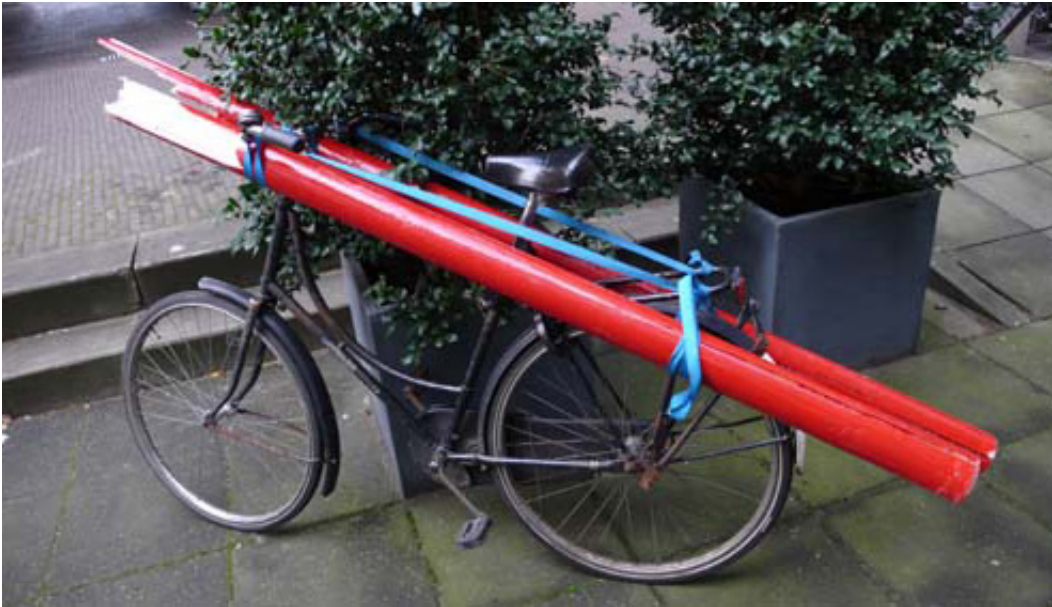
2007, Diptych, inkjet prints of fine art paper. Exhibition view from In search of Paradise , Galerie Ferdinand van Dielen, 2007, Amsterdam. Ed. of 5 + 2 A.P.

La série photographique en couleurs « Après la Chute » intègre dans sa composition différents éléments : une barrière de saut d'obstacle hippique peinte en rouge, un vélo et des bacs à plantes extérieurs. Une des images livre un gros plan de la barre de saut brisée en deux et reposant au sol. Une autre donne à voir les deux fragments produits par la cassure chargés sur un vélo et attachés à l'aide de ruban de transport bleu. Le vélo apparaît posé contre un des bacs à plantes urbains où poussent des arbustes.