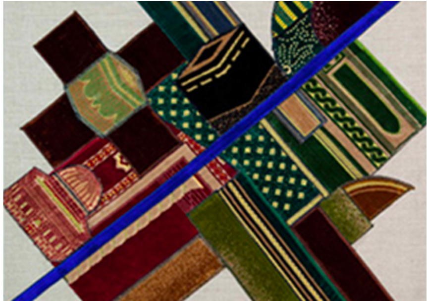
2014-2015, collage with prayer rugs on canvas, 80 x 80 cm. Exhibition view from Art Brussels, Keitelman Gallery, 2015, Brussels.