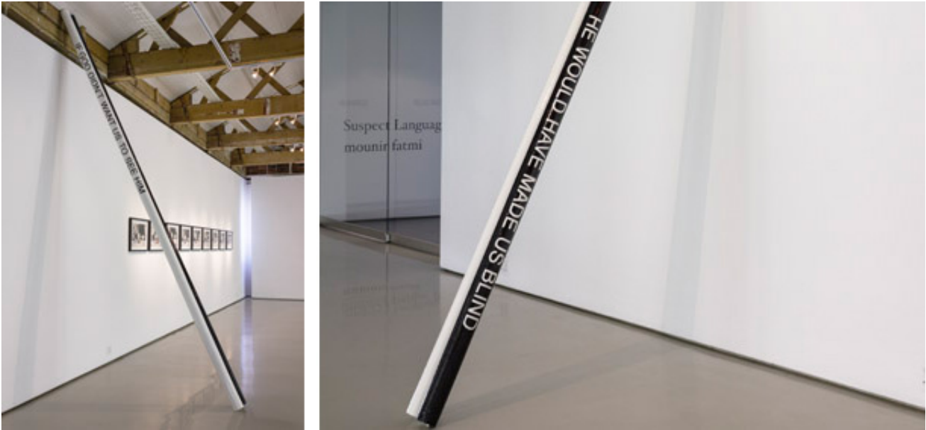
2007, obstacles, 3m50 x 10 cm each. Exhibition view from Suspect Language, Goodman Gallery, 2012, Cape Town. Ed. of 5 + 1 A.P.

This work was part of Biennale de Bruxelles - Fuck architects: chapter III, Brussels, 2008.