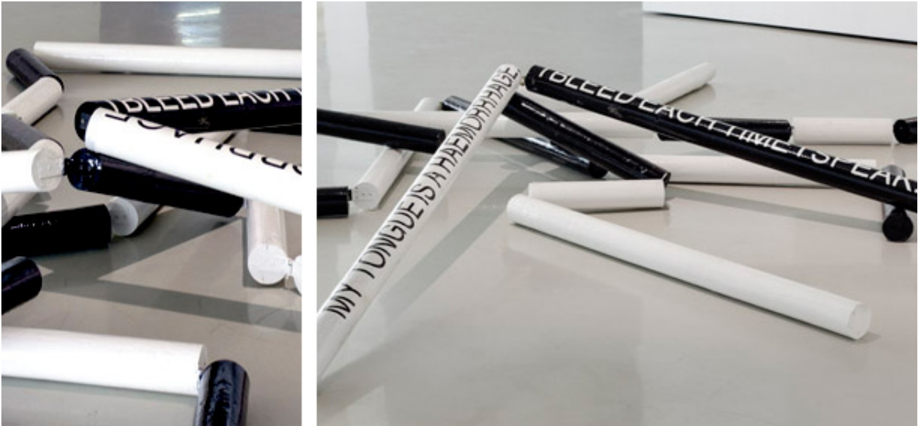
2007, obstacles, 4 m x 10 cm each. Exhibition view from Suspect Language, Goodman Gallery, 2012, Cape Town. Ed. of 5 + 1 A.P.

La série de sculptures « Obstacle, coma, posologie » est réalisée au moyen de barrières de saut d'obstacle hippique, matériau fréquemment employé par mounir fatmi dans ses œuvres. Peintes en noir et blanc, les barres portent des inscriptions tirées du manifeste de l'artiste. Certaines d'entre elles apparaissent brisées en plusieurs endroits et reposent au sol, enchevêtrées. D'autres sont disposées par paires, accolées l'une à l'autre et maintenues en équilibre contre les murs de l'espace d'exposition.