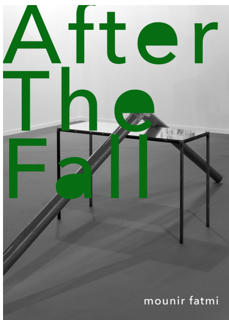
After the Fall

In search of paradise - Ferdinand van Dieten Gallery - Solo show