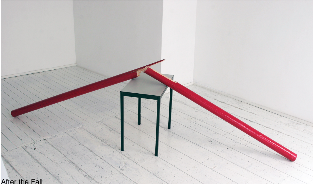
After the Fall

In the artist's universe, "obstacle" is defined as the "hardship of reality," and as such represents the primary stimulus to our body and intellect. The artist also produces "obstacles," works that stand in opposition to the reality of our world, in order to better understand it, in order to precipitate action.