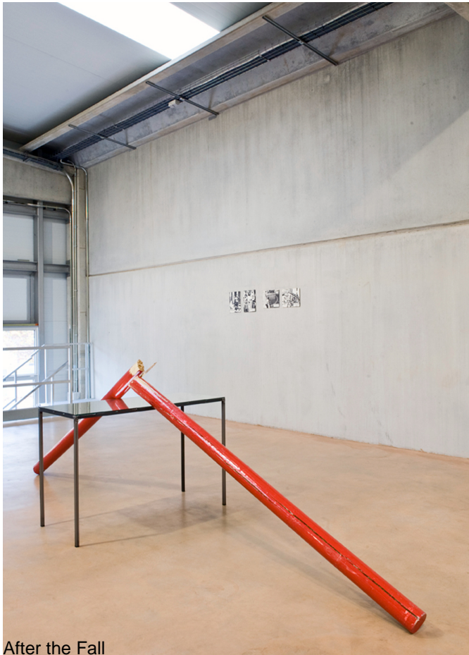
After the Fall

different, or, simply, to reflect upon the event in order to explore the very nature of "obstacle," and thus of reality.