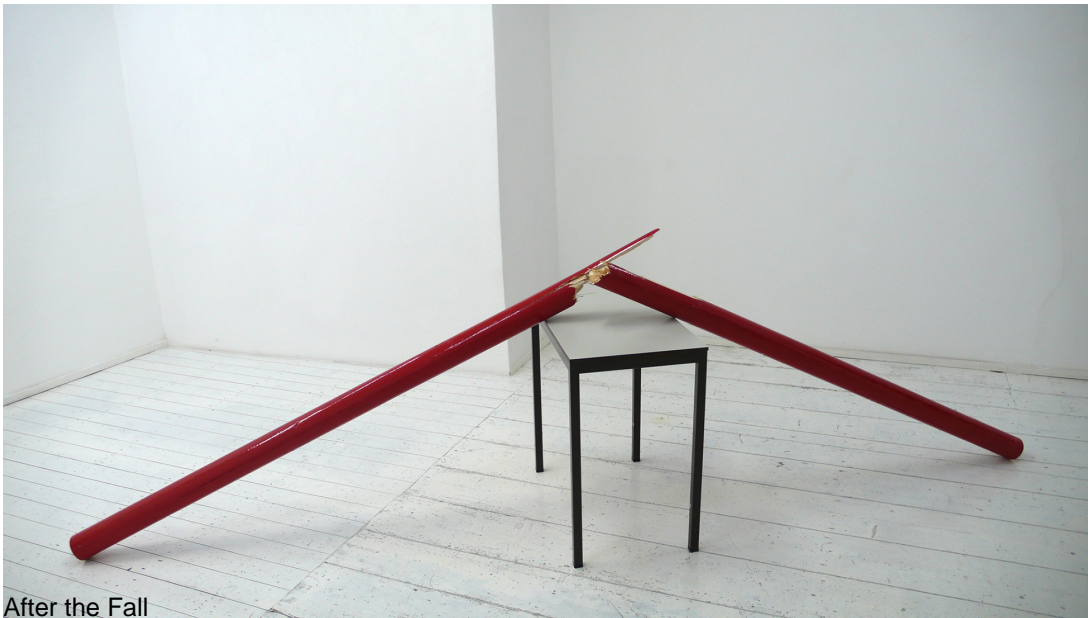
After the Fall

The sculpture After the Fall features a wooden horse jump pole, painted red and broken in two. The fragments lean upon a metal table with a mirrored top which reflects the fractured pole. Jump poles are frequently used in Mounir Fatmi's work, often to symbolize the relationship between the individual and the world, or reality.