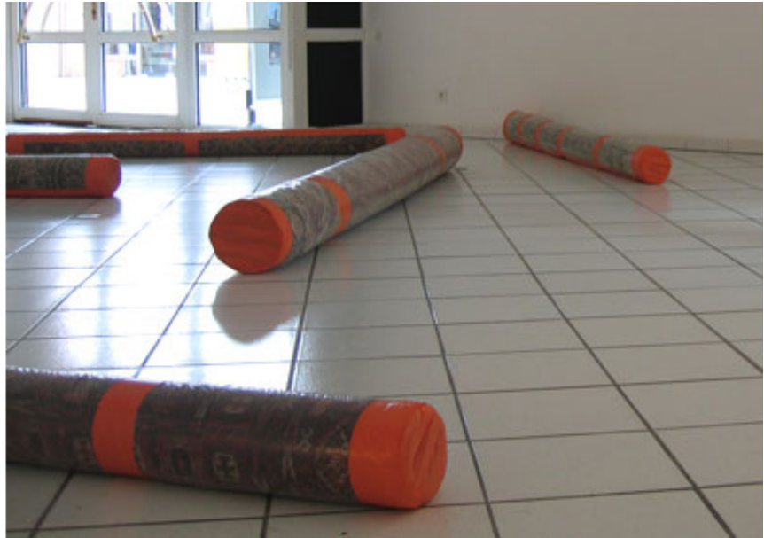
2004, carpets wrapped in plastic, tape. Exhibition view from Jusqu'au bout de la poussière, espace des arts, 2004, Colomiers. Ed. of 5 + 1 A.P.

Embargo est une sculpture réalisée au moyen de tapis orientaux qui ont été enroulés sur eux-même puis glissés dans des housses de plastique transparentes scellées avec du ruban adhésif orange vif. Les tubes obtenus sont ensuite déposés au sol sans ordre apparent.