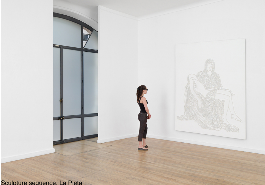
Sculpture sequence, La Pieta

The sculpture is a reproduction of the interpretation of the artistic theme of the Pieta, which belongs to Christian iconography – its model is the late 15th century sculpture by Michelangelo, which has become one of the most famous works of art of all time.