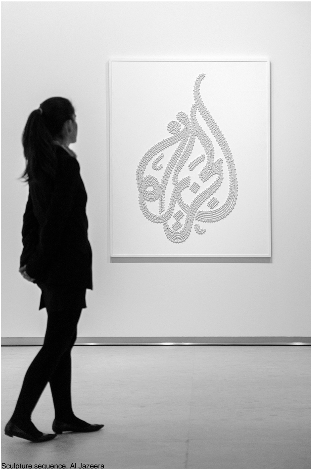
Sculpture sequence, Al Jazeera

The work questions the place of communication and media exposure in today's societies and tries to define the relation of contemporary art to images and their power. It is inspired in part by the philosophical notions developed by Guy Debord, Wittgenstein's linguistic concepts on the production of significations and by artistic movements such as Pop Art and Minimalism.