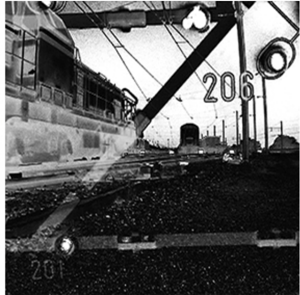
2002-2006, sound compilation.

Obtenue par l'entrelacement de trois pistes sonores, la compilation sonore « Tracked Memory » explore l'histoire et l'imaginaire collectif du progrès technique et du développement des moyens de transport et de communication. Entraînant l'auditeur dans un voyage à travers différents pays et différentes époques, les enregistrements audio progressent le long de voies de circulation, empruntent ses bifurcations, se perdent dans de nombreux embranchements, déviations et croisements aux allures de réseau neuronal.