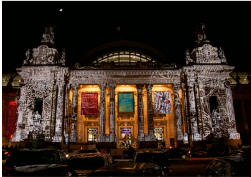
2010-2012, France, video installation, 15 min, HD, B&W, stereo. Size may vary, video projection. Exhibition view from Art Paris, Grand Palais, 2015. Courtesy of the artist.

L'installation Les Temps modernes consiste en une projection lumineuse et cinétique qui se déroule en extérieur, sur les édifices architecturaux des villes, ou en intérieur sur les murs des espaces d'exposition artistique. Elle donne à voir une ample et complexe composition géométrique mêlant des cercles en rotation, des lignes s'entrecroisant, des motifs calligraphiques circulaires et des symboles linguistiques : lettres arabes accompagnées de leur transcription phonétique universelle. L'œuvre s'accompagne d'une bande sonore tissée de distorsions acoustiques plus ou moins stridentes.